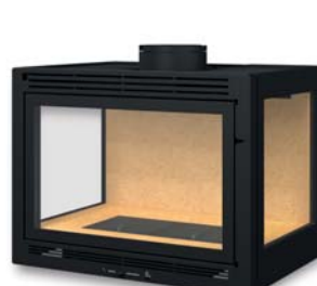
3 faces avec toit plat 3 Faces with a flat roof