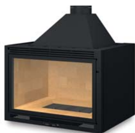
frontal avec avaloir démontable Frontal with a removable trap