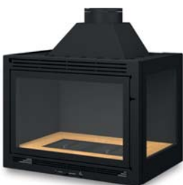
latéral avec avaloir démontable et fond acier lateral with a removable trap and a steel back panel