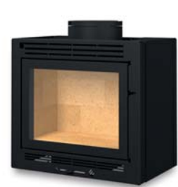
frontal avec toit plat Frontal with a flat roof